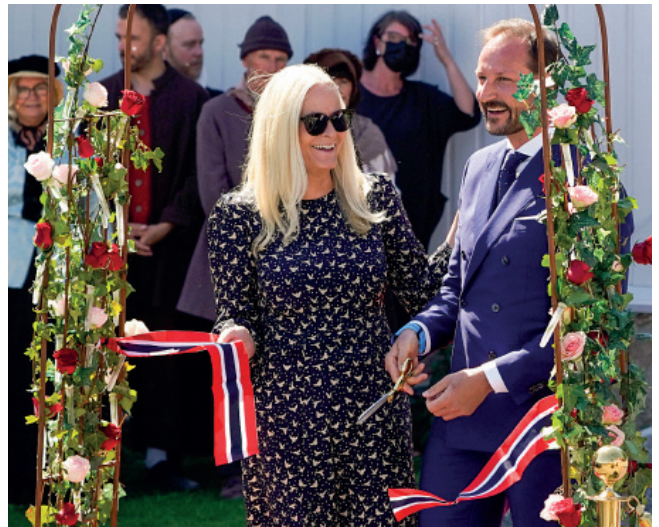
Kronprinsparet klipper snoren til det nye besøksenteret. Mens den dansk-norske kong Christian VI forfulgte Hans Nielsen Hauge, ble Hauge hyllet av dagens norske kronprinspar under markeringen av 250-årsjubileet.

- Fortellingen om Hans Nielsen Hauge er en påminnelse til oss alle om å møte krefter som ønsker