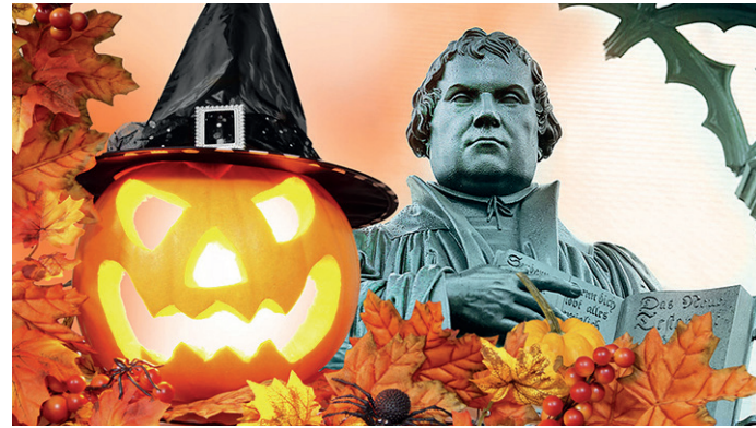
Slik illustreres Halloween, Allehelgensdag og Reformasjonsdag på nettsidene til den tyske TV-kanalen SWR. Er det tilfeldig at alt markeres samtidig, eller har de noe med hverandre å gjøre?

Martin Luther var brennende uenig i forestillingene rundt skjærsilden, og slo opp sine teser om dette og annet 31. oktober, dagen før