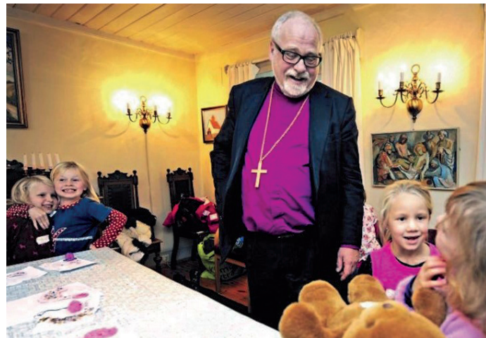
Biskopen prøvde seg som barnepasser, stod det i menighetsbladet da Atle Sommerfeldt var på visitas i Gamle Glemmen i 2012. Det er en aktivitet han nå ser fram til å få mer tid til som pensjonist – og morfar.

- Det er det vel andre som kan vurdere bedre enn meg. Men jeg vil anta at mitt bidrag til strategisk utvikling internt og eksternt, inkludert å styrke frimodigheten som aktør i det offentlige rom og arbeidet for interreligiøst og interkulturelt samarbeid, vil være viktig.