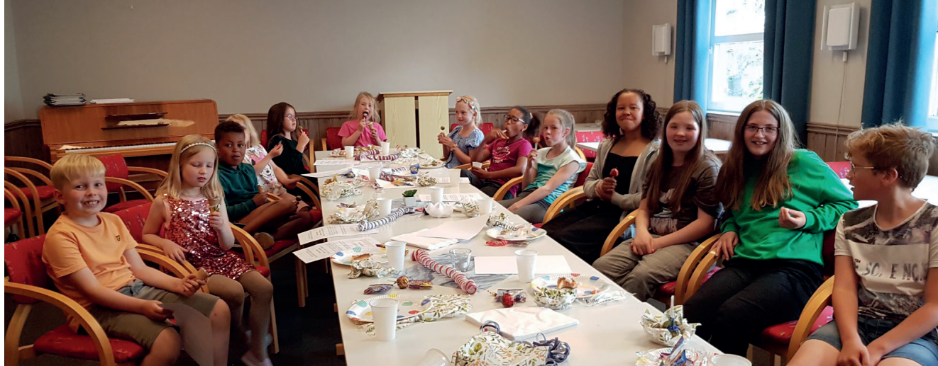
God stemming i barnegospel-koret under sommeravslutningen. Taket og veggene i den minste salen i bedehuset salen er nymalt, og på gulvet er det nye teppefliser.